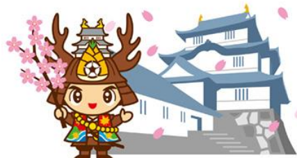
大多喜シンボルキャラクター 桜っき